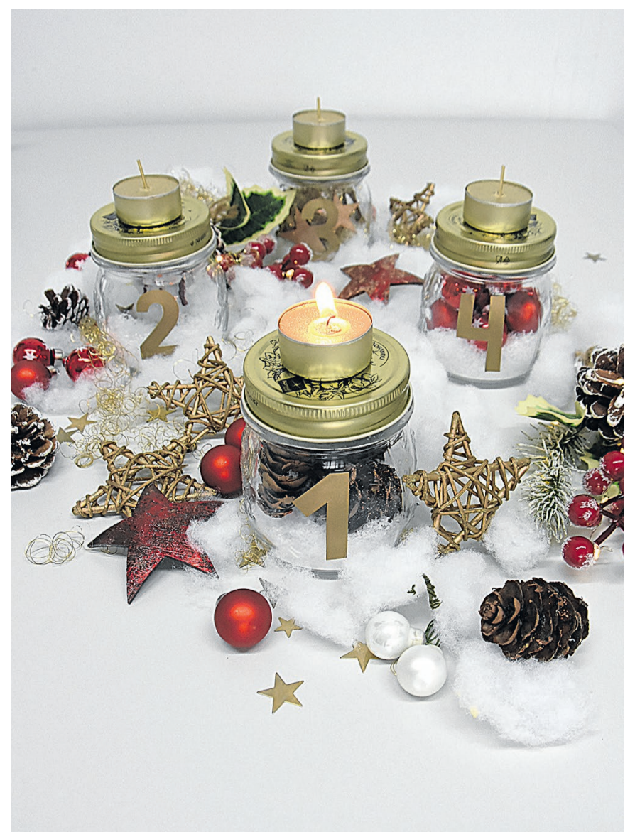
Am Sonntag ist es dann endlich so weit: Die erste Kerze darf angezündet werden.