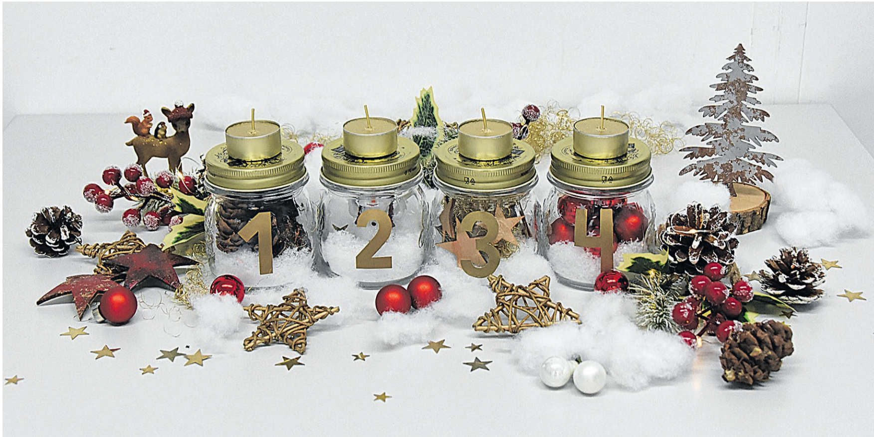
Ob im Kreis oder aufgereiht – dieser einzigartige Adventskranz macht immer eine gute Figur.