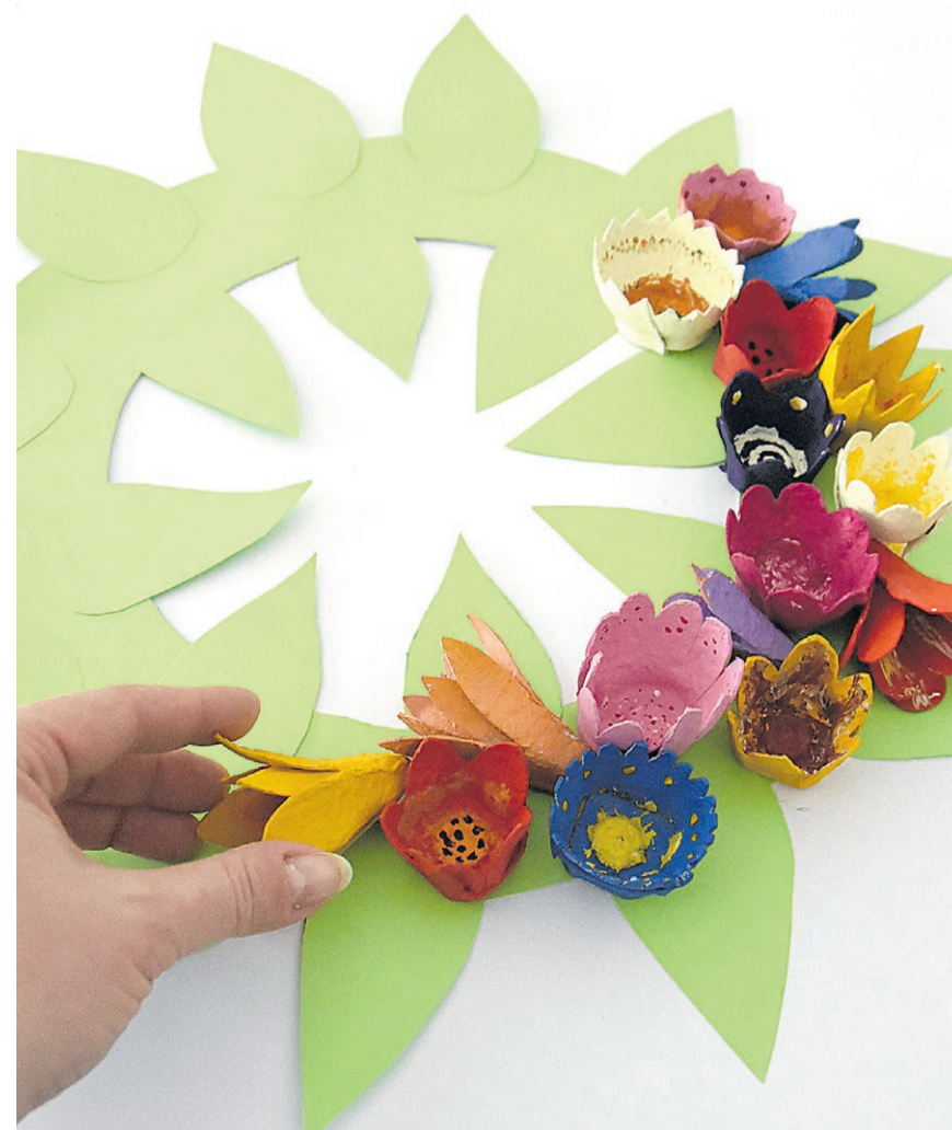
Zu guter Letzt werden die fertigen farbigen Blüten am Kranz festgeklebt.