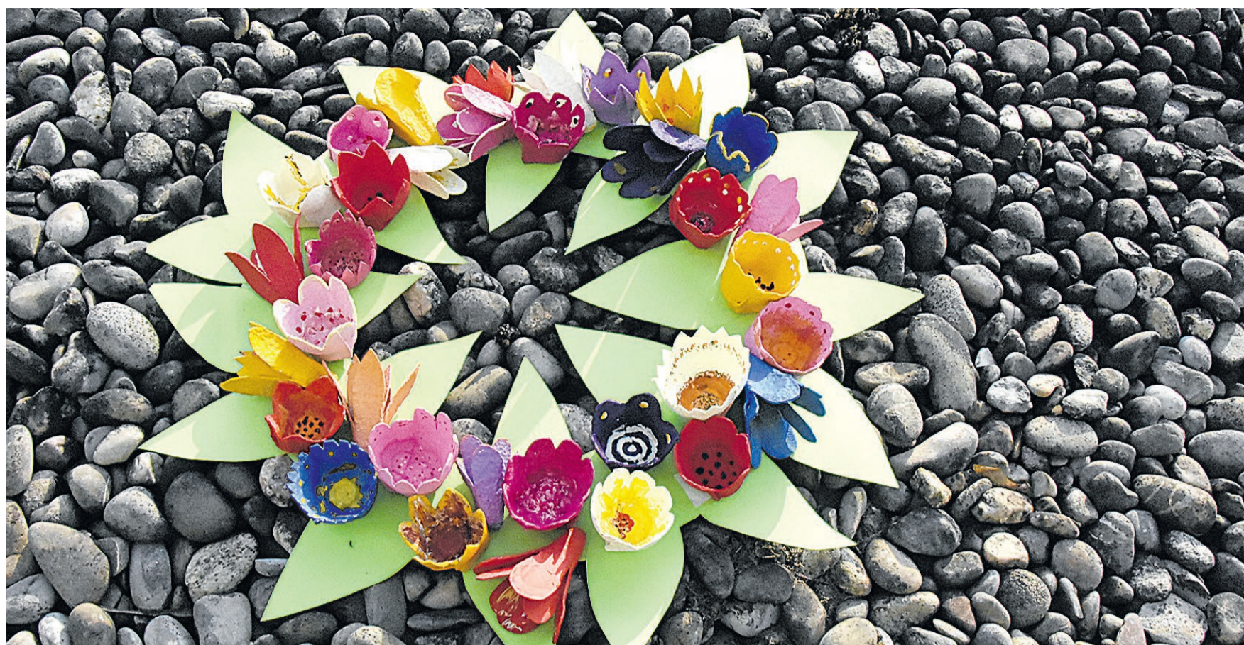
Ob an der Wand, auf dem Tisch oder draussen an einer wetterfesten Stelle – der Kranz macht eine gute Figur.