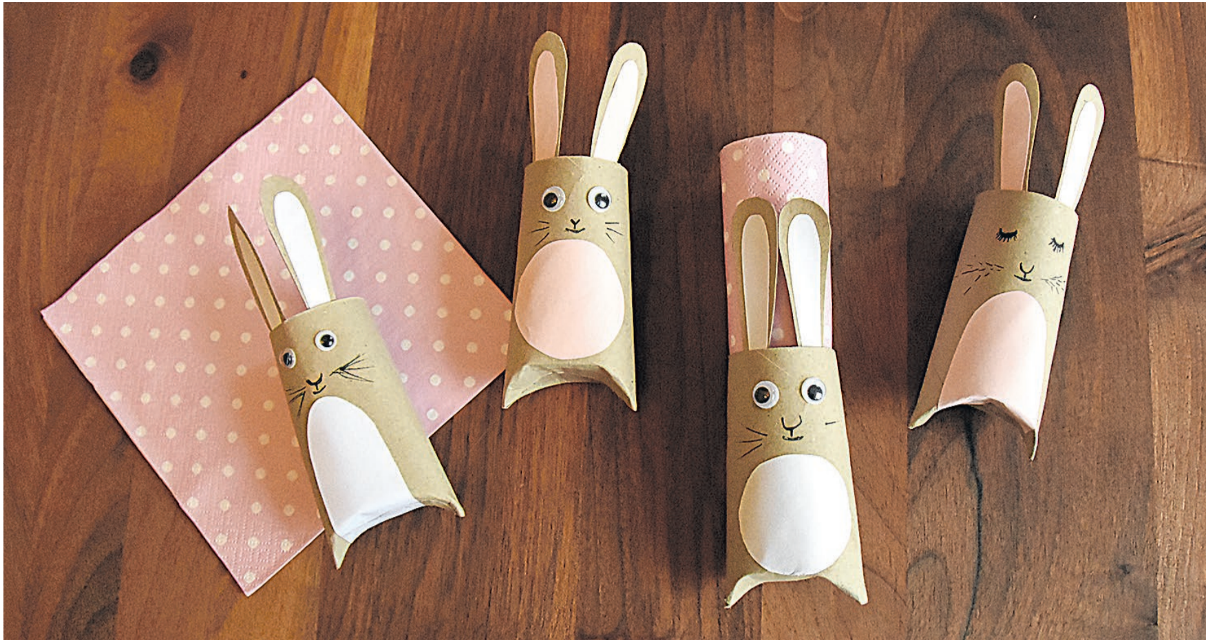
Die süssen Osterhasen lassen sich je nach Laune, Inneneinrichtung, Tischdekoration und Gusto verzieren.