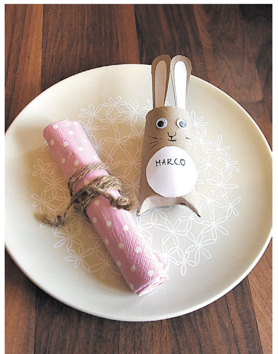
Als Tischkärtchen braucht das Häschen jetzt natürlich noch ein Namensschild oder eine Beschriftung.