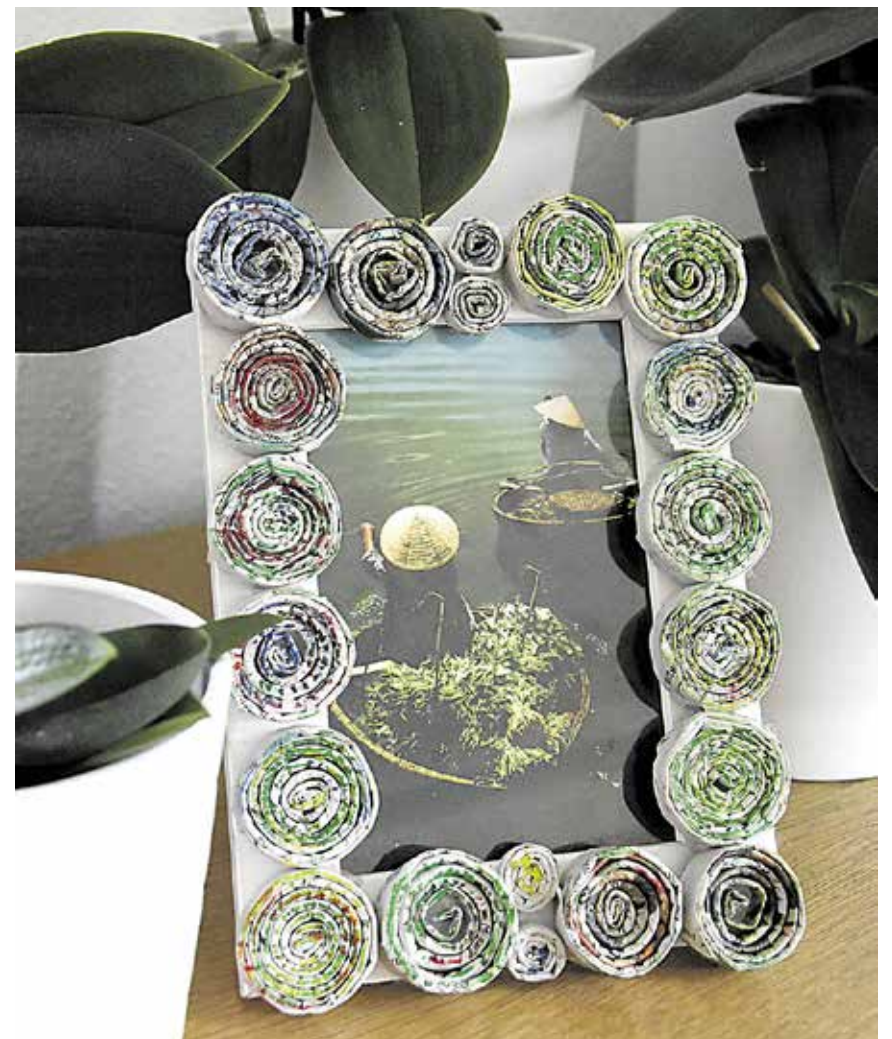
Die Farben können zum gewählten Standort passen.