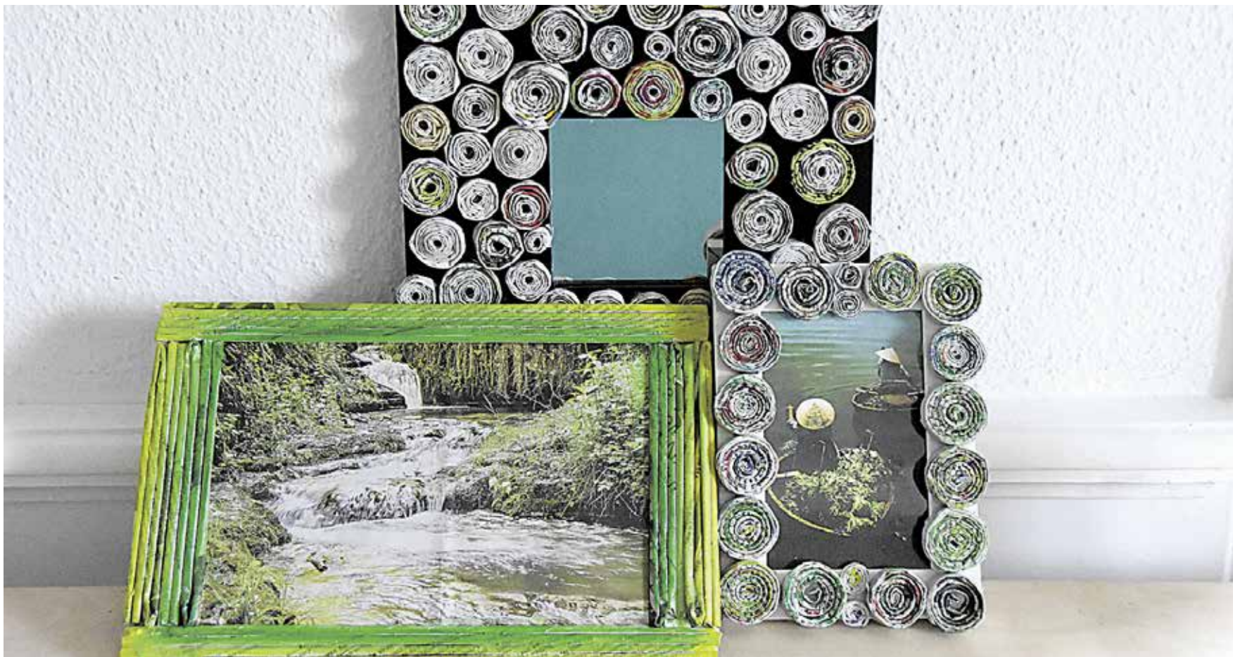
Die Zeitungsrollchen sorgen für einen besonderen Hingucker und verleihen einem farblosen Rahmen plötzlich neuen Glanz.