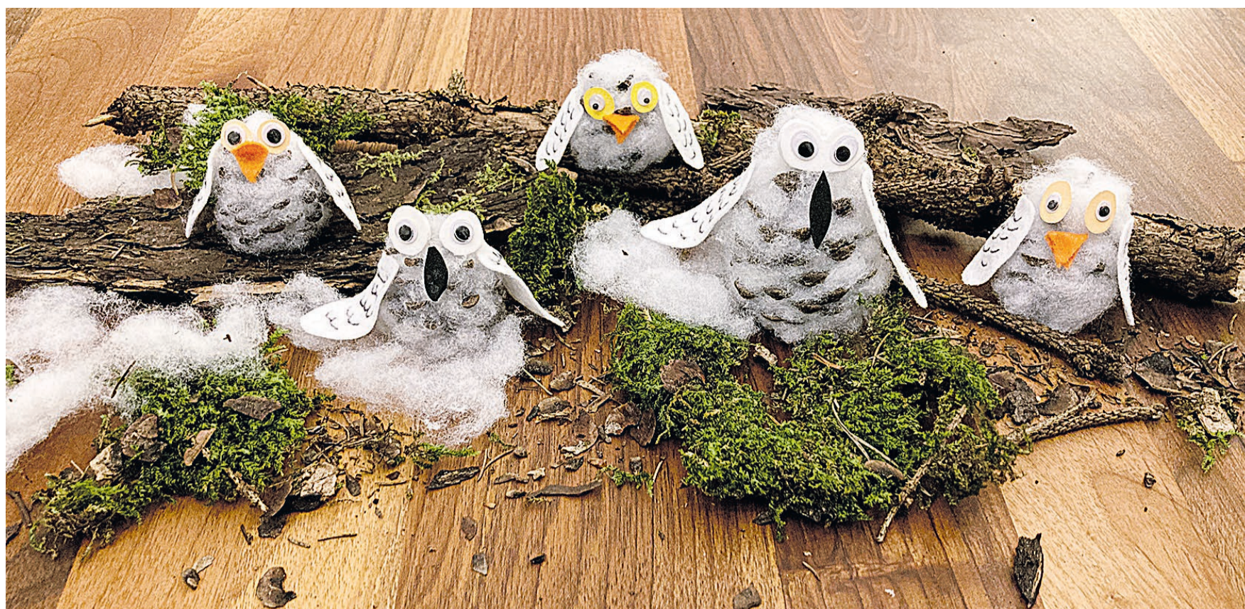
Durch das Stopfen mit weisser Watte wirkt das Federkleid der niedlichen Schneeeulen beinahe echt.