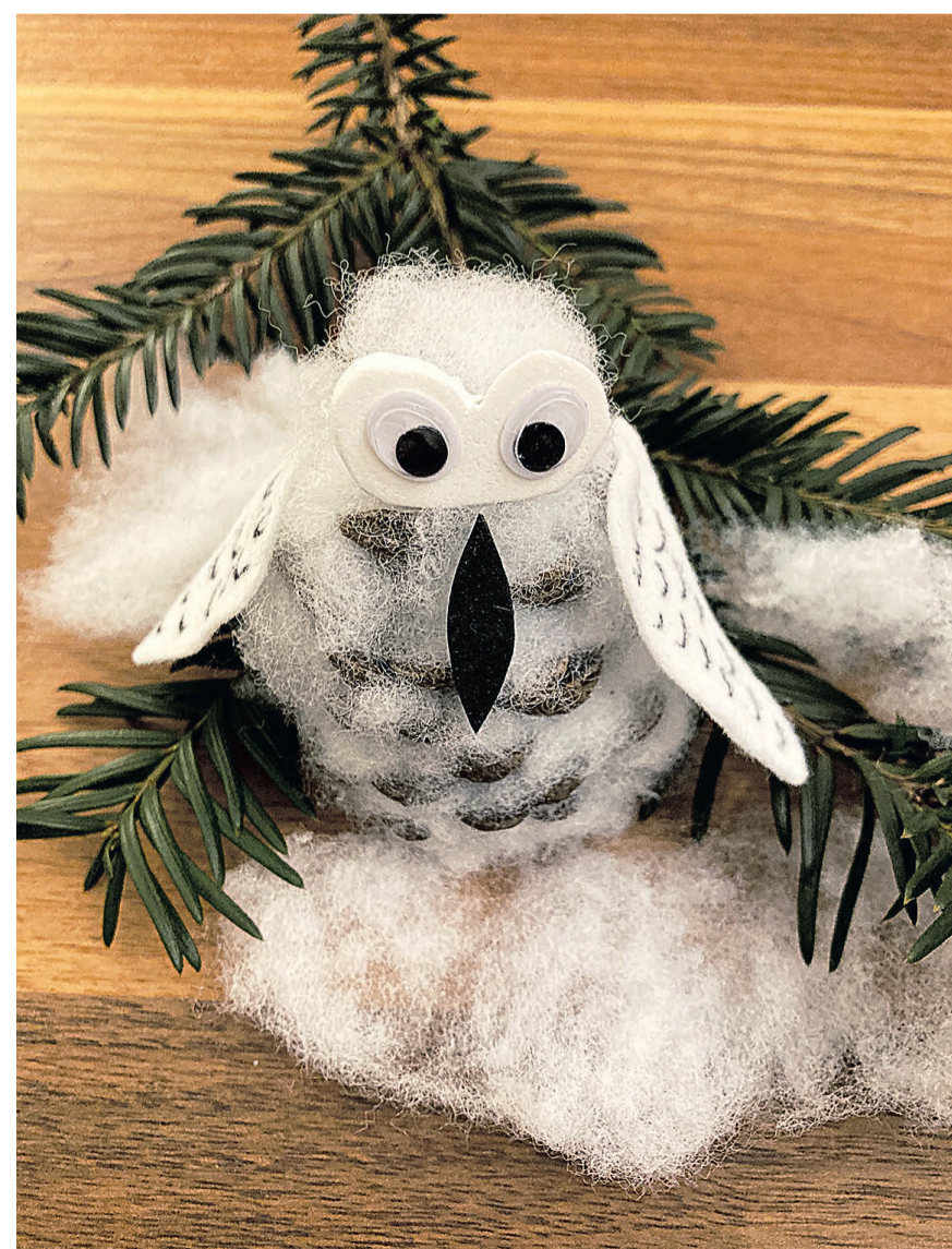
Um das Gesicht zu betonen, ist es zusätzlich möglich, eine ovale Herzform auszuschneiden und die Augen darauf zu kleben.